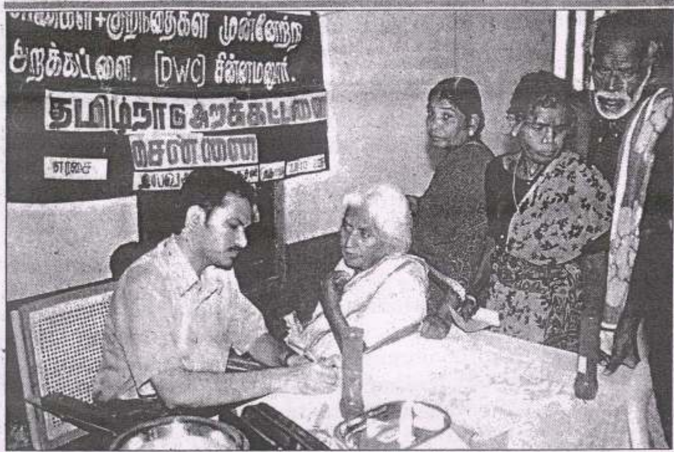
கண் பரிசோதனை முகாமின் போது எடுக்கப்பட்ட படம்.